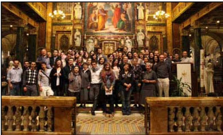
Turin, Italie. Départ missionnaire à la Basilique de Marie Auxiliatrice. Tradition initiée par Don Bosco en 1875. Différents membres de la Famille Salésienne partent vers les 5 continents, dont plusieurs laïcs, surtout de jeunes adultes. / Missionary departure from the Basilica. Among them, many lay people & young adults.

-Blessed be God who raises up in so many young people an earnest desire for the Kingdom in the style of Don Bosco and accompanies the formation process of our communities - aspirantates, prenovitiate, novitiate, postnovitiate and theologates.