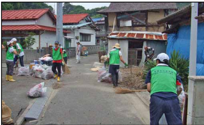
Shioyama City, Japon. Du volontariat pendant les vacances de 71 jeunes d'une école salésienne de Yokohama renait l'espérance; ils aident à la reconstruction après le tsunami. / Volunteer service by 71 students of Salesio-Gakuin High School brings hope after tsunami.