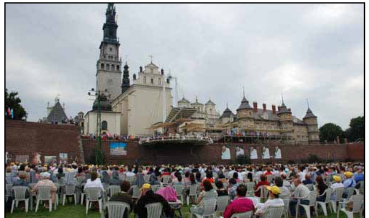
Czestokowa, Pologne. Le VI Congrès International de l'ADMA (Association de Marie Auxiliatrice) s'est tenu au renommé sanctuaire marial à la mi-août. / The VI World Congress of ADMA ( Association of Mary Help Christians) was held in the renowned Polish Marian sanctuary in mid August.