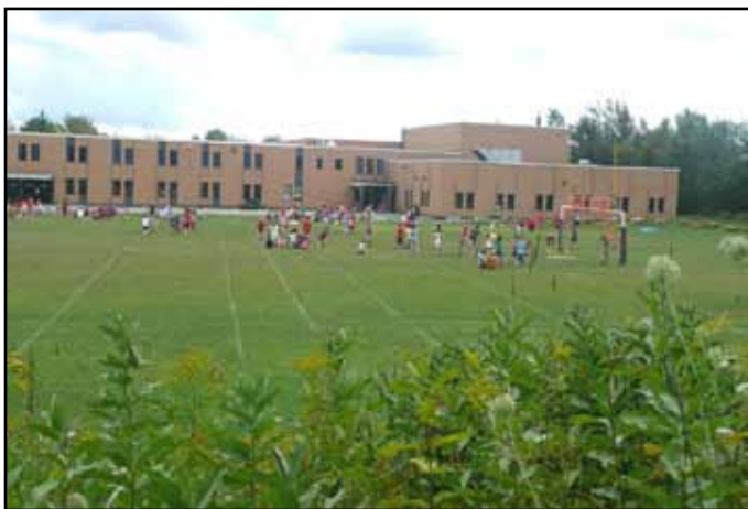
Sherbrooke. Les terrains et bâtiments du Séminaire étaient à la disposition de l'OTJ du quartier Nord du 27 juin au 12 août. / The site of the Séminaire is used in summer time by the City for a Day Camp for some 300 children.

-Blessed be God who makes His church grow in the parish communities and centres for evangelisation entrusted to the Salesians and in missionary parishes