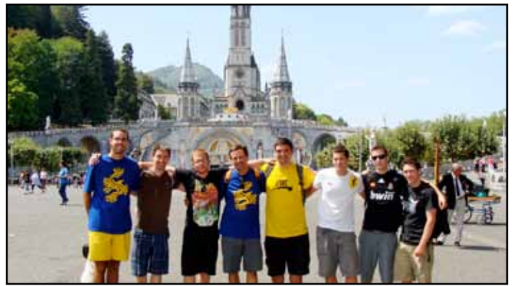
Lourdes, France. Une visite à Lourdes du groupe JMJ de Sherbrooke. / At end of WYD pilgrimage, the Sherbrooke group thanks Our Lady for a safe & wonderful journey.

goal to which we are called: full communion with the Lord. Our entire life is a journey towards the Unity and Trinity of Love which is God; we can live our lives in the certainty that we will never be abandoned. Dear young people of Croatia, I embrace all of you as sons and daughters! You have a place in my heart and I leave you my blessing. «Rejoice in the Lord always!» May his joy, the joy of true love, be your strength. Amen. Praised be Jesus and Mary!