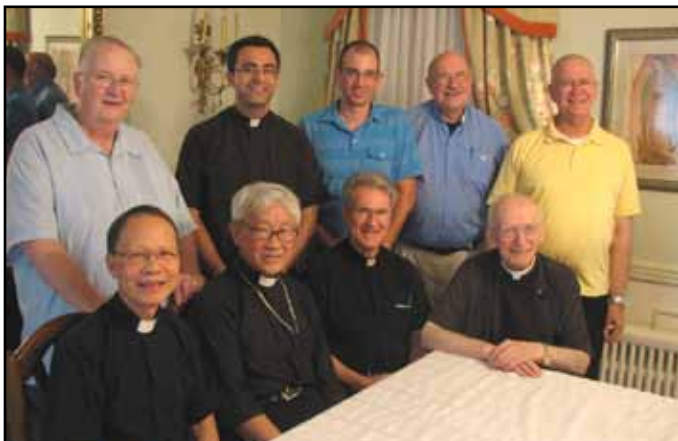
Toronto. The bishop emeritus of Hong Kong visiting the Toronto community. / L'évêque émérite de Hong Kong, le Cardinal Joseph Zen, rend visite aux salésiens de Toronto.

Les Salésiens nous offrent le dîner au Restaurant Maman Marguerite et tous sont épatés par la qualité (et aussi la quantité!) des repas italiens. On y prend goût assez rapidement, je dois l'avouer! Ce jour-là, nous faisons