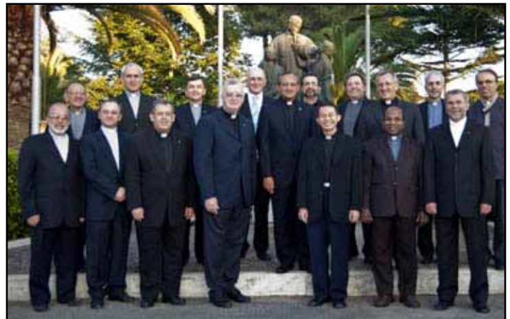
Rome. Le conseil général des salésiens : session d'été à la maison généralice. / General Council of the Salesians in its Summer session, July 2011.