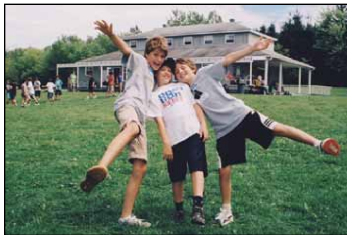
Sherbrooke, Camp Savio. En plus de recevoir des jeunes, familles et groupes d'adultes, Savio accueille souvent les étudiants du Séminaire. « La cour de récréation pour se rencontrer en amis et vivre dans la joie ». / Camp Savio often welcomes the Séminaire students : « A playground where friends can meet and enjoy themselves. »