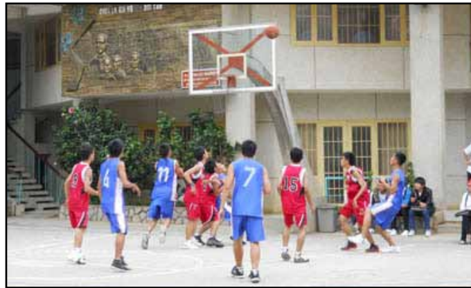
Dalat, Vietnam. L'œuvre salésienne Michel Rua organise pendant les vacances estivales pour les jeunes du quartier des activités sportives, musicales et récréatives, animées par les jeunes salésiens en formation. / A Salesian Oratory organises sport and musical activities for youths of neighbourhood, animated by Salesians in formation.

final, ils nous auront permis de mieux comprendre et de réaffirmer notre foi. On nous y invite également à devenir témoins, à transmettre aux autres la joie que nous avons vécue lors des JMJ.